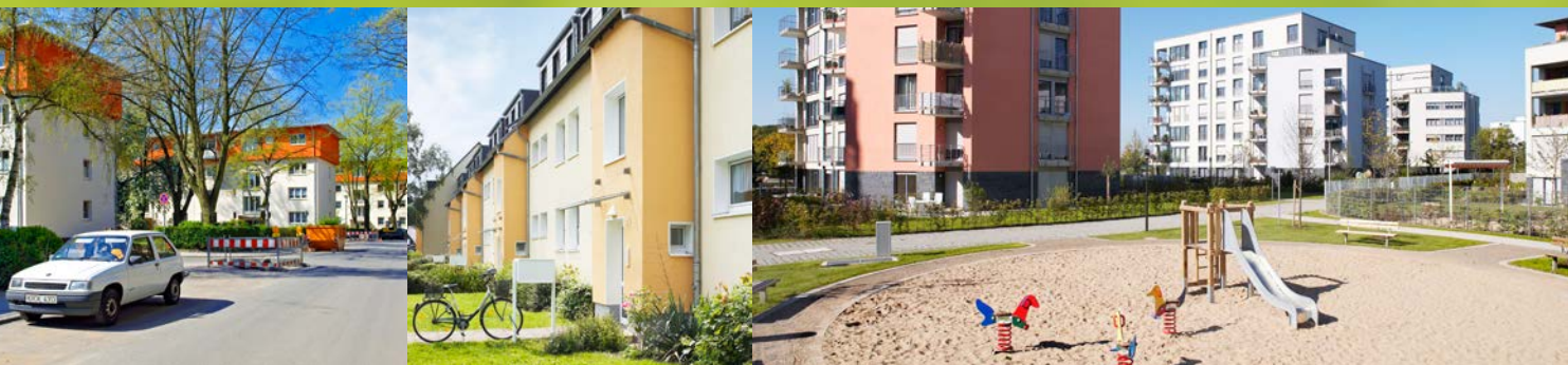
Renovierte Fordsiedlung in Niehl | Wohnhaus am Burger Platz in Höhenhaus | Spielplatz am Rheinrefugium